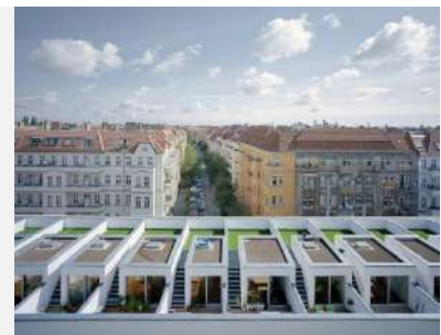
2011 Zanderroth Architekten, Germania