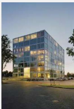
2013 Atelier Kempe Thill, Olanda