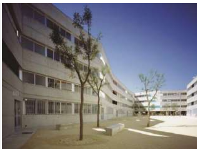
2007 Guillermo Vàsquez Consuegra, Spagna

Le candidature vanno inviate entro il 29 settembre 2017 per accedere alla prima fase. Al vincitore il premio in denaro di 10.000 Euro e la nomina in giuria per l'edizione seguente. Tutte le info qui: http://premiobaffarivolta.ordinearchitetti.mi.it/