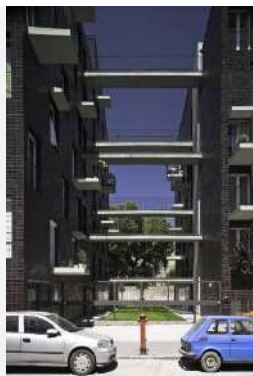
2009 Kis Péter Építésmuterte, Ungheria