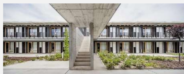
2015 H Arquitectes+DataAE, Spagna