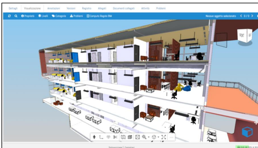
CDE Namirial Building in cloud: visualizzazione di un file BIM standard IFC

Con l'avvento del BIM e della digitalizzazione delle opere nella Pubblica Amministrazione le informazioni andranno considerate come la materia prima del modello economico e dovranno quindi essere mappate, gestite e controllate in modo preciso in ogni fase del ciclo di vita dell'opera, per ogni attore coinvolto nei processi.