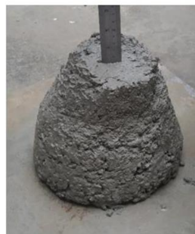
Riduzione della fluidità/lavorabilità a causata da SRA antievaporante