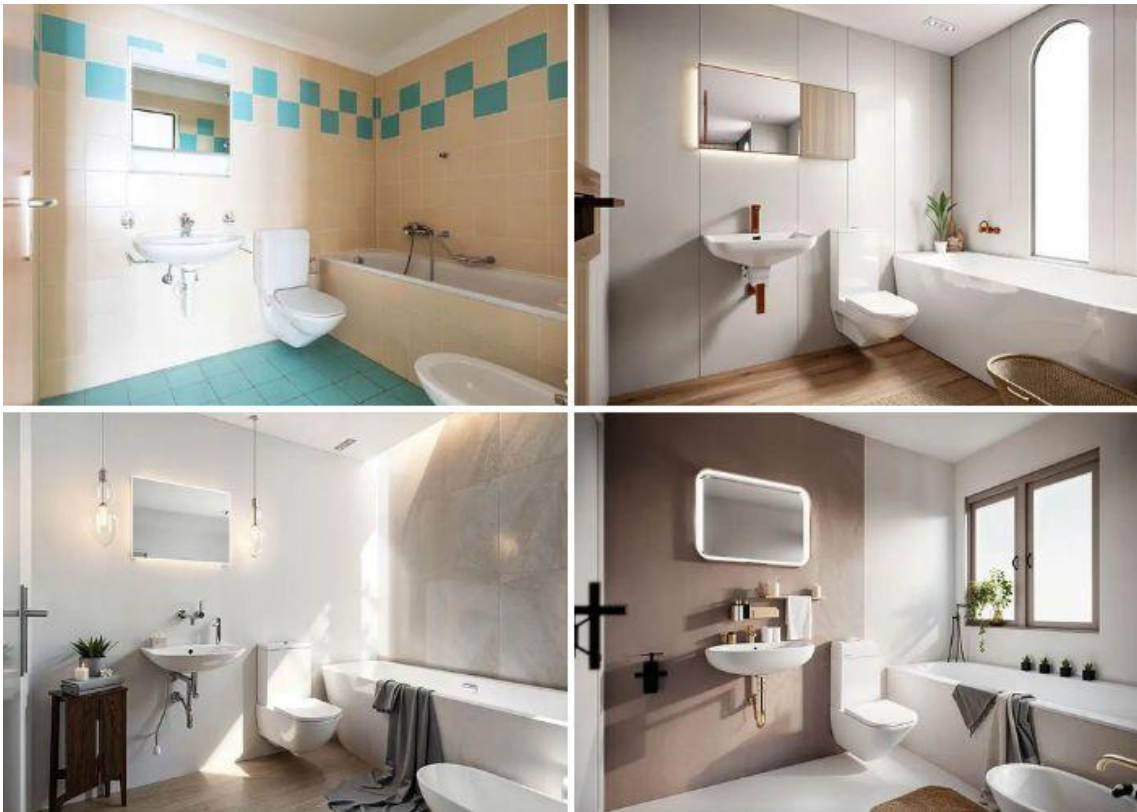
Riqualificazione architettonica di ambienti esistenti | usBIM.codesign AI