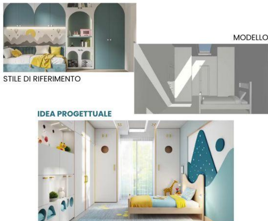
Dal modello all'idea progettuale | usBIM.codesign AI